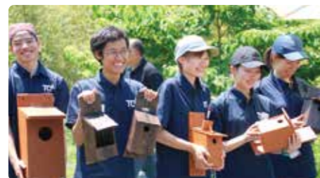
お手伝いしてくれた東京コミュニケーション アート専門学校のみなさん