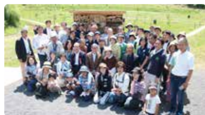
イベントに参加していただいたみなさん