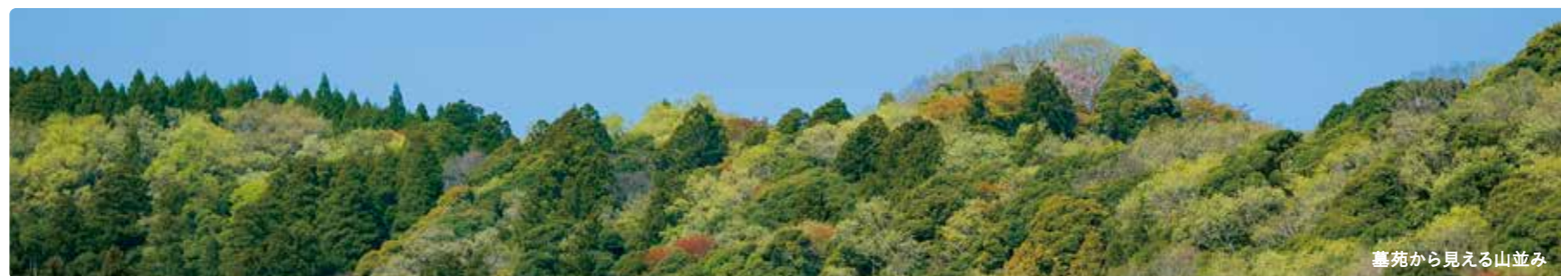
墓苑から見える山並み