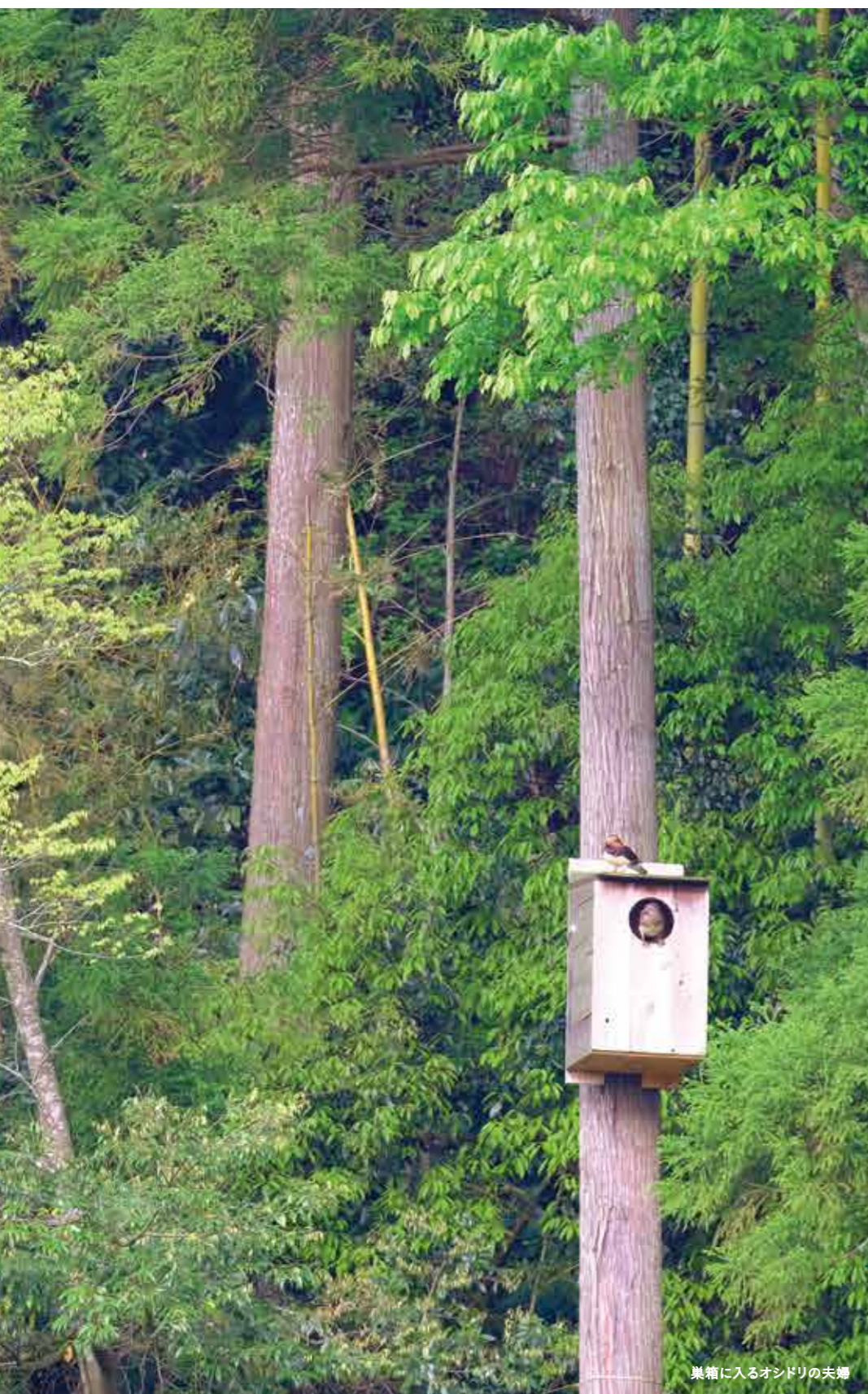
巣箱に入るオンドリの夫婦